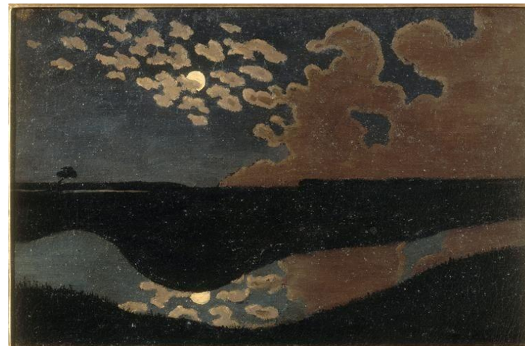
Félix VALLOTTON. Clair de lune . vers 1895.

Photographie de garde Simon Cavalier, prise pour l'évènement du 5 juillet 2025 de Kanlaréla , collectif extra disciplinaire pour atelier artistique et bien être auprès d'aïdés et leurs aidants à Saint-Félicien (07).